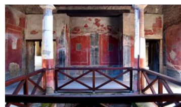
Villa San Marco - Stabia