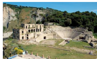
Pausilypon - teatro