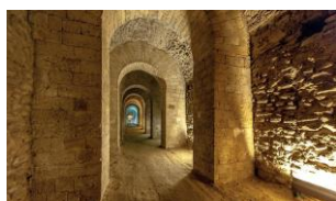
Grotta di Seiano

Esso comprendeva, sulla terrazza superiore, due edifici per spettacoli, il teatro e l'Odeion (piccolo teatro coperto destinato ad ospitare concerti o audizioni di poesie). Insieme a questi edifici, il complesso ospitava anche un Tempio o Sacrum posto ad oriente del teatro e un Ninfeo posizionato nella zona occidentale. Vi si gode un panorama eccezionale. Scendendo da Posillipo, sosta per foto panoramica da via Orazio o da via Petrarca. Sistemazione in Hotel. Cena e pernottamento.