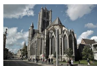
Gand: san Bavone