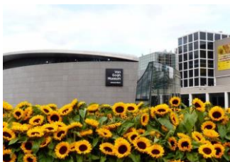
Museo Van Gogh