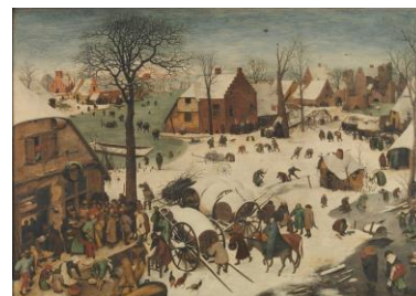
Bruxelles: Museo di Belle Arti