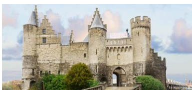
Anversa: il castello