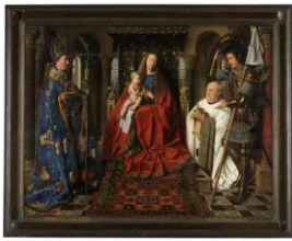
Bruges: Museo di Belle Arti

Prima colazione in hotel e check out. Mattinata visita guidata al Groeninge, il Museo di Belle Arti di Bruges allestito all'interno dell'antico Ospedale di San Giovanni, che possiede una ricca collezione di opere dei maestri fiamminghi e belgi (tra cui quelle dei Primitivi fiamminghi), come Van der Weyden, Van Eyck, Memling e Bruegel il Vecchio. Per concludere, giro in barca per i pittoreschi canali 'Reien' di Bruges che ci permetterà di scoprire i posti più belli della città visti da tutta un'altra inquadratura. Tempo a disposizione per il pranzo libero. Nel pomeriggio proseguimento per Amsterdam. Lungo il tragitto, sosta a Kinderdijk per una visita esterna al più pittoresco complesso di mulini a vento dell'Olanda. Arrivo ad Amsterdam, sistemazione presso l'hotel riservato ed assegnazione delle camere. Cena e pernottamento in hotel.