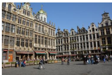
Bruxelles: Grand Place

Nel primo pomeriggio visita alle collezioni dei Musei reali di Belle Arti del Belgio che copre il periodo che va dal XV al XXI secolo. Visita alla sezione dedicata agli "Old Masters": vi scopriremo opere di pittori europei dal XV al XVIII secolo tra cui alcuni dei più grandi capolavori di Pieter Bruegel il Vecchio. Il percorso espositivo sarà multimediale e attraverso la realtà virtuale sarà possibile immergersi nei dipinti di Bruegel scoprendone i più fini dettagli. Al termine della visita partenza per Bruges. Si raggiungerà l'hotel prenotato ed assegnazione delle camere riservate. Cena e pernottamento in hotel.