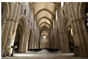
Abbazia di Fossanova: interno