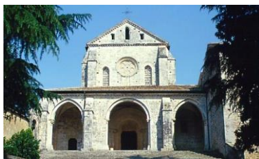
Abbazia di Casamari