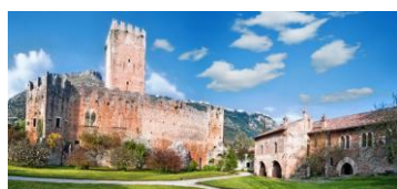
Giardino di Ninfa