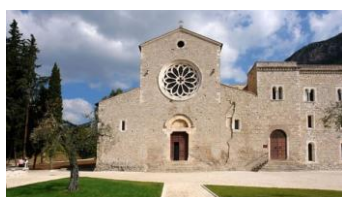
Abbazia di Valvisciolo