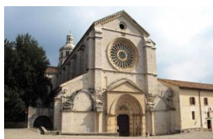
Abbazia di Fossanova

Pranzo libero. Cena e pernottamento in hotel a Gaeta.