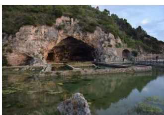
Grotta di Tiberio