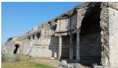
Santuario della Fortuna Primigenia