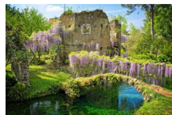
Giardino di Ninfa