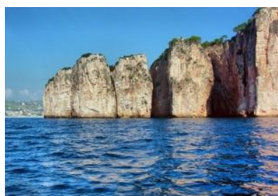
Gaeta: Monte Orlando