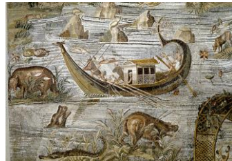
Mosaico l'Inondazione del Nilo