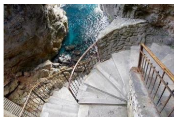
Gaeta: Grotta del Turco

La mattina sarà dedicata a Gaeta, con la visita della Cattedrale e alle fenditure del Monte Orlando dove si trovano la Grotta del Turco e il Santuario della S.S. Trinità; non trascureremo il Castello e la chiesa dell'Annunziata. Nel pomeriggio visiteremo l'area archeologica della villa di Tiberio e il borgo di Sperlonga. Cena e pernottamento in hotel a Gaeta.