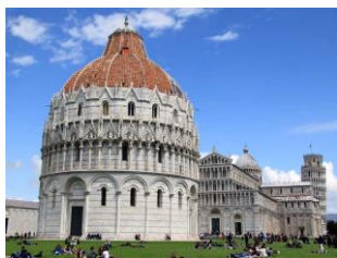
Pisa: Battistero di San Giovanni

Pranzo al ristorante. Nel pomeriggio rientro a Milano in treno e ad Agrate in pullman con arrivo previsto in tarda serata.