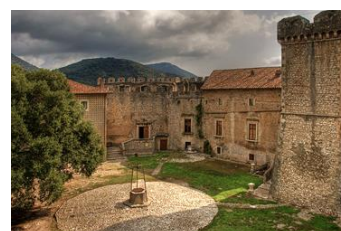
Sermoneta: castello Caetani