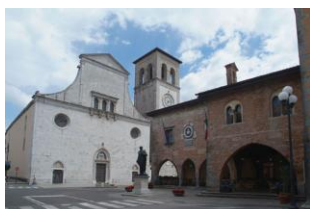
Cividale del Friuli

Alla mattina partenza per Cividale del Friuli: visiteremo il Duomo con battistero e museo annessi, il Tempietto longobardo e il museo archeologico. Pranzo libero. Nel pomeriggio è prevista la visita di Udine: il centro storico, il Duomo, l'Oratorio della Purità e Palazzo Arcivescovile. Rientro a Grado, cena e pernottamento in hotel.