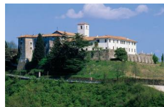
Abbazia di Rosazzo