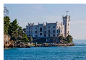
Castello di Miramare