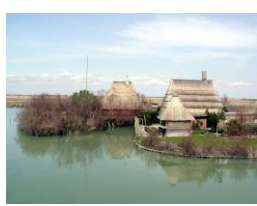
Foci dello Stella