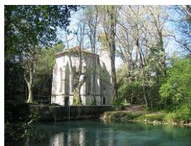
Bocche del Timavo