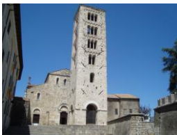
Cattedrale di Anagni

Prima colazione in hotel e mattinata dedicata alla visita della Villa Adriana, uno dei complessi archeologici più suggestivi della romanità, che rispecchiano lo spirito raffinato dell'imperatore Adriano. Pranzo libero. Nel pomeriggio, visita di Villa d'Este, famosa per i giardini arricchiti da fontane e splendidi giochi d'acqua. Rientro in hotel a Castel Gandolfo per la cena ed il pernottamento.