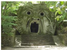
Bomarzo: Parco dei Mostri

dell'originaria fortificazione. Nel pomeriggio visiteremo il Parco dei Mostri di Bomarzo o Sacro Bosco, disseminato di gigantesche figure mostruose e fantastiche. Pranzo libero. Rientro in hotel a Viterbo per la cena ed il pernottamento.