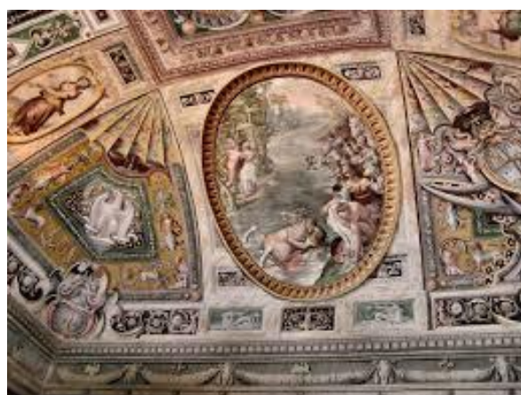
Villa d'Este: interni