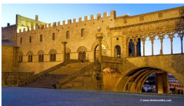
Viterbo: Palazzo dei Papi

Prima colazione in hotel e partenza per l'intera giornata a Subiaco, dove iniziò la sua avventura monastica San Benedetto, prima di trasferirsi a Montecassino. Verranno visitati il Monastero di Santa Scolastica, dove nel 1464 fu impiantata la prima tipografia italiana, e il Sacro Speco, costruito sopra la grotta dove San Benedetto trascorse i primi anni. La guida sarà locale. Pranzo libero. Trasferimento in hotel a Viterbo per la cena ed il pernottamento.