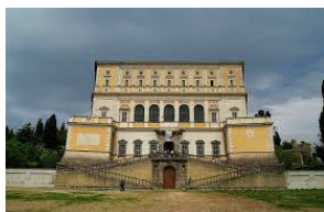
Caprarola: Palazzo Farnese