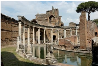
Tivoli: Villa Adriana

Appuntamento alle ore 06.15 presso la sede STM di Agrate e trasferimento con pullman privato alla stazione Centrale o Garibaldi di Milano; treno per Roma in partenza alle ore 7 - 7.30 . Arrivo a Roma alle ore 10 - 10.30. Trasferimento a Castelgandolfo e pranzo libero. Nel pomeriggio visita dei giardini Barberini con una guida locale. I giardini della residenza papale sono stati aperti per la prima volta nel 2014 su iniziativa di Papa Francesco e sono stati subito caratterizzati da un notevole afflusso di visitatori. Per chi lo desidera, sarà possibile partecipare alla Santa Messa nella chiesa di San Tommaso da Villanova alle ore 18.30. In serata sistemazione presso l'Hotel Castelvechio nelle camere riservate; cena e pernottamento.