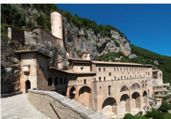
Subiaco: Sacro Speco

Prima colazione in hotel e mattinata dedicata alla visita della Cattedrale romanica di Anagni con la sua cripta dal ricco pavimento cosmatesco. Pranzo libero. Pomeriggio ad Alatri: visita dell'Acropoli fortificata di epoca romana, della chiesa di Santa Maria Maggiore e del quartiere medioevale. Rientro in hotel a Castel Gandolfo per la cena ed il pernottamento.