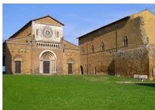
Tuscania: San Pietro