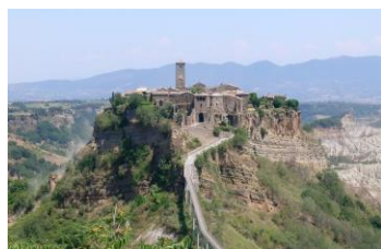
Civita di Bagnoregio

Prima colazione in hotel. Alla mattina escursione al lago di Bolsena per ammirarne il bel paesaggio. Nel pomeriggio visita alle chiese di San Pietro e Santa Maria Maggiore a Tuscania, che fu centro etrusco, municipio romano e libero comune nel Medioevo. Pranzo libero. Rientro in hotel a Viterbo per la cena ed il pernottamento. .